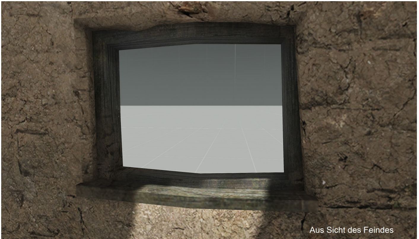
Aus Sicht des Feindes

In geduckter Stellung ist der Soldat Nr. 3 von der Sicht des Feindes aus nicht zu erkennen